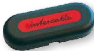
AMS-Set - AV6220