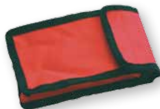
AMS 1000V-Set - 1713 0